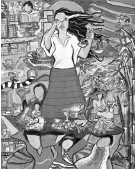
Titelbild zum Weltgebetstag der philippinischen Künstlerin Rowena Laxamana-St. Rosa

Globale Gerechtigkeit steht im Zentrum des Weltgebetstags von Frauen der Philippinen